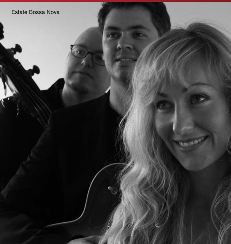
Estate Bossa Nova

Estate widmet sich der intimen und warmen Stimmung, die den Bossa Nova-Liedern oft inne wohnt und kombiniert dies mit einem eigenen skandinavischen Klang. Die Gruppe spielt akustische Bossa Nova Songs legendärer brasilianischer Komponisten und eigene Lieder.